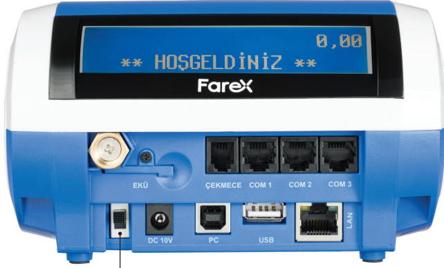
AÇMA / KAPAMA ANAHTARI