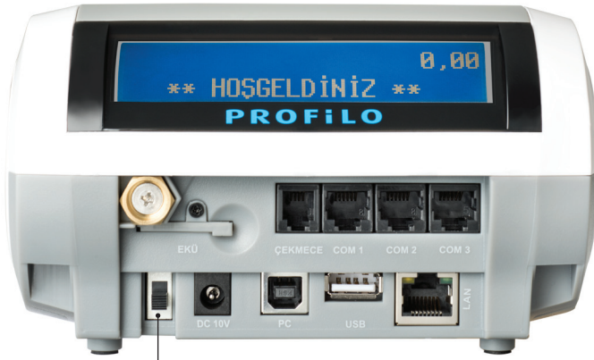
AÇMA / KAPAMA ANAHTARI