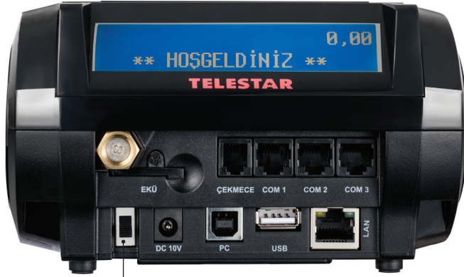
AÇMA / KAPAMA ANAHTARI